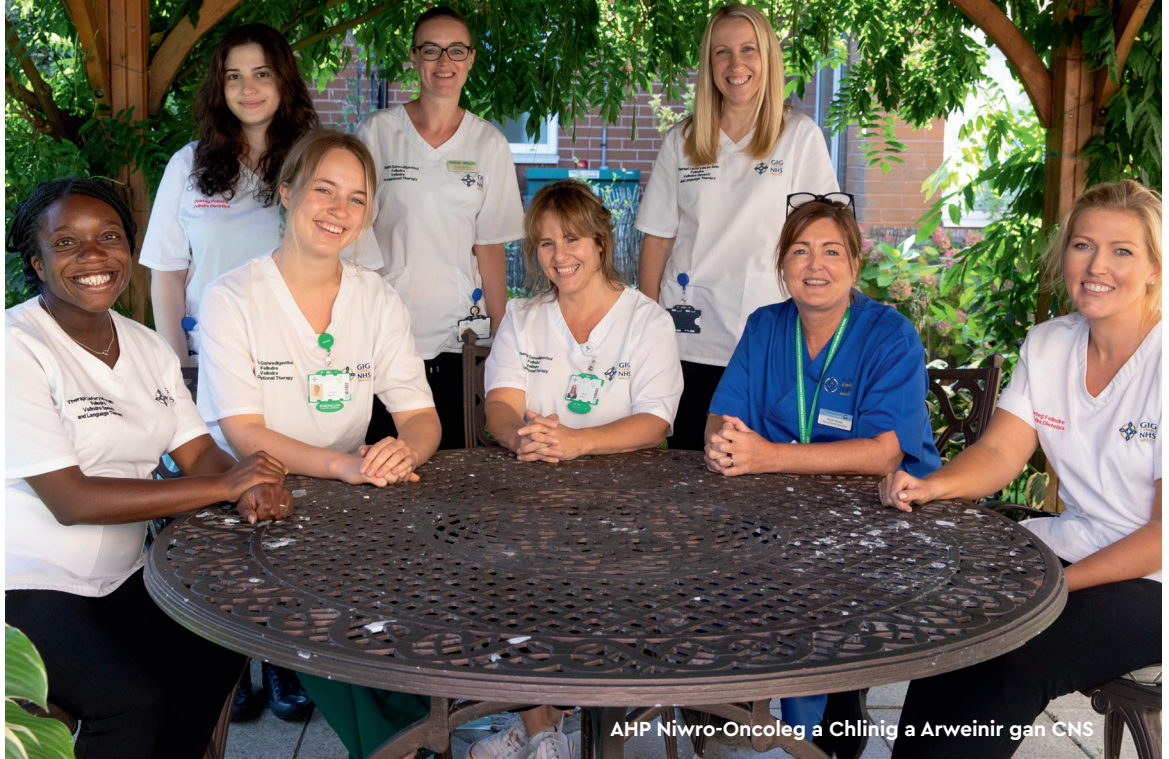
AHP Niwro-Oncoleg a Chlinig a Arweinir gan CNS