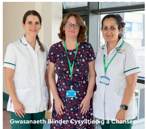
Gwasanaeth Blinder Cysylltiepig a Chanse

Mae adran yng nghefn y llyfryn hwn i'ch helpu gyda'r cwestiynau y gallech fod am eu gofyn ac adran lle gallwch wneud nodiadau.